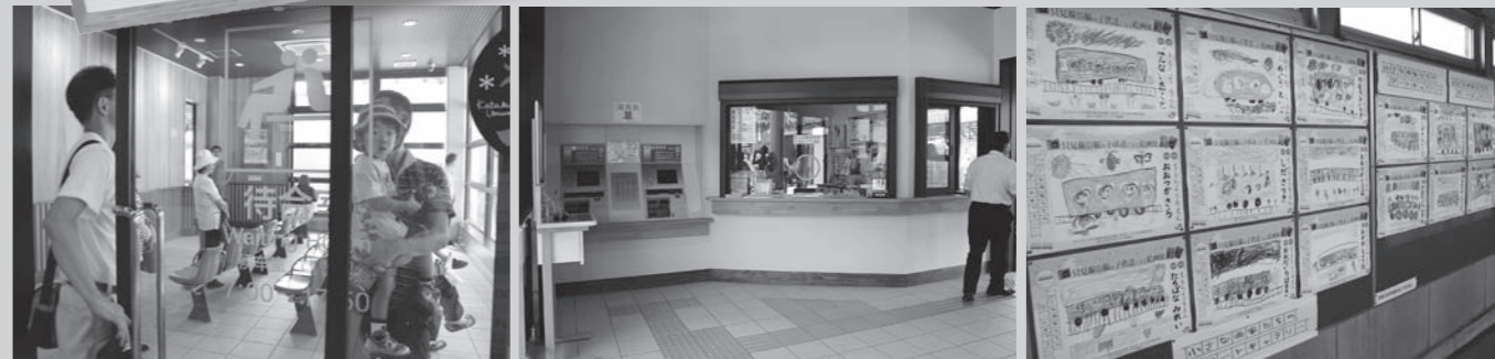
魚沼杉の香りが広がる待合室

駅舎の入口に設置してあるのは、小出出身の俳優・渡辺謙さん揮毫による駅銘額。板は魚沼杉を使用。