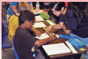
先生姿もなかなかのもの