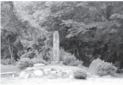
新保にある「館ノ内居館跡」