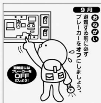
県東北電気保安協会