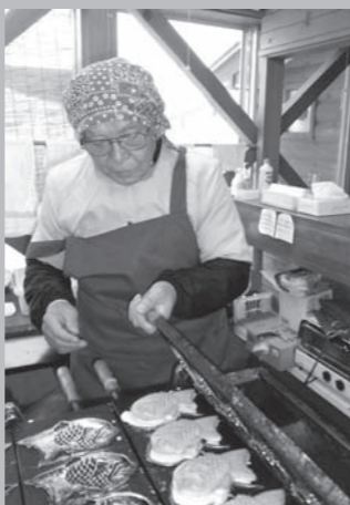
真剣な眼差しで調理中。

地域社会へ出での活動は、施設を利用する方の就労意欲を高めるだけでなく、その活動を目にする人が、障害への理解を深めるきっかけとなります。