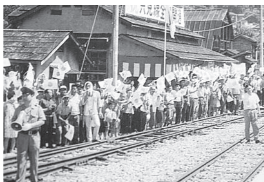
上・全線開通の日の菰神駅周辺（広神村史から転載）