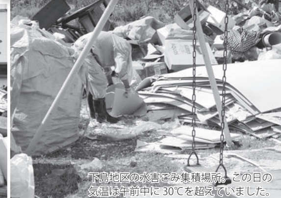
下島地区の水害ごみ集積場所。この日の気温は午前中に 30℃を超過していました。