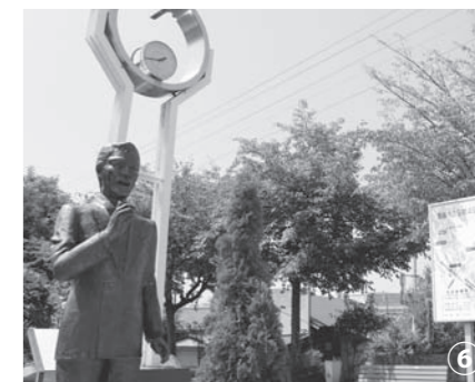
会津坂下駅前に建立された春日八郎像。