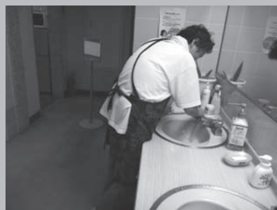
市役所の清掃作業。とても丁寧な仕事ぶりで、庁舎はピカピカです。