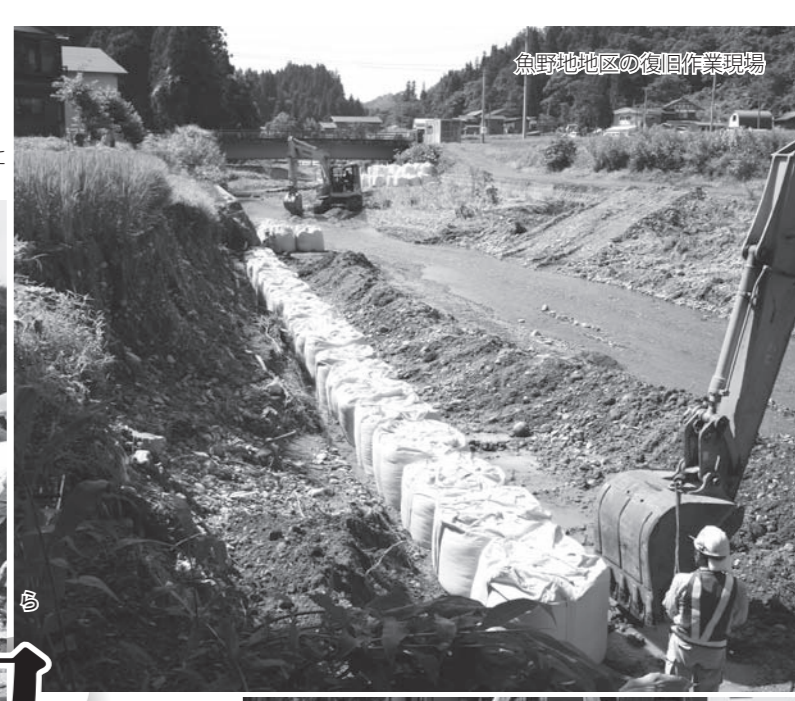
魚野地区の復旧作業現場