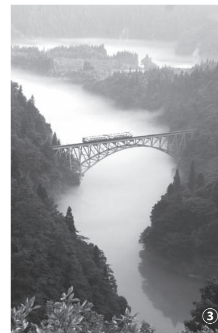
有名撮影スポット。会津西方駅と会津松原駅の中間です。（歩いていくには遠すぎるので、車でおでかけしてみてください）