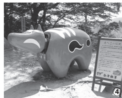
会津柳津駅から10分ほどの福満虚空蔵尊圓蔵寺には赤べこ伝説が残されています。