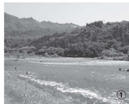
只見駅から徒歩約10分にある只見川。“川の駅”がすぐ目の前にあります。

※ここに掲載した場所に限らず、只見線沿線では豪雨により被災した場所がたくさんあります。お出かけの際は状況をご確認ください。