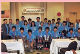
使節団のメンバーとパチリ