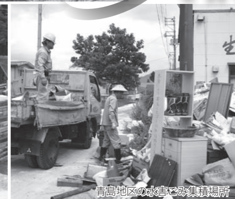
高島地区の水害ごみ集積場所