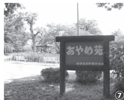
東北一の規模を誇るあやめ苑。会津高田駅から約1.6kmの伊佐須美神社内にあります。