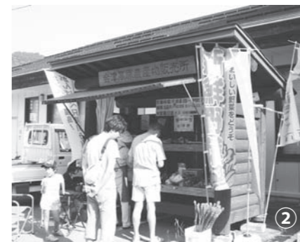
会津川口駅に隣接した野菜直売所。ちょっとしたぞいてみたくなっちゃいますね。