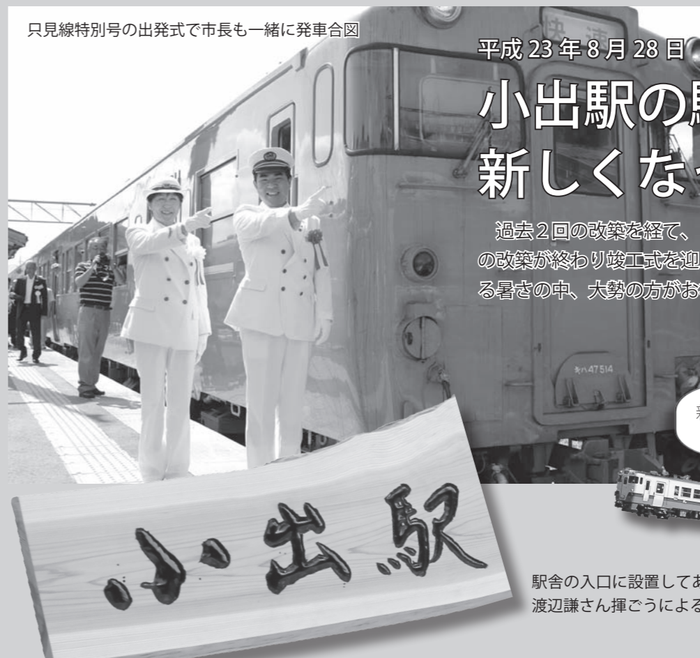
只見線特別号の出発式で市長も一緒に発車合図

長い道のりになるかもしれませんが、40周年を迎えた人気者のローカル線・只見線が復活し、小出と会津若松間をのんびりと走る姿が一日も早く見られるよう、心からお祈りいたします。