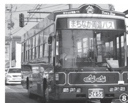
七日市駅を降りて街を歩くと、かわいいバスが走っています。