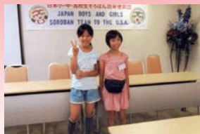
ルームメイトと一緒に