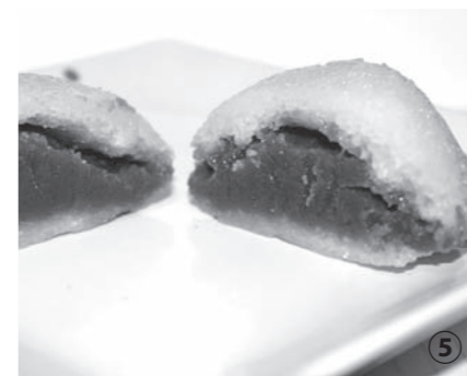
柳津温泉名物・栗まんじゅうは災いに“あわ”ないようにとの願いが込められています。