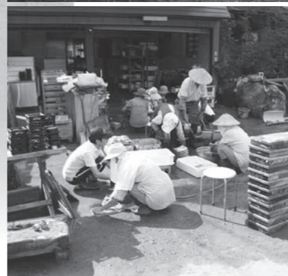
土砂で汚れた食器や調理道具を、大勢の人たちが協力して洗っていました。

完全に元通りになるまでには時間がかかりますが、復旧に向けて全力で取組を進めています。