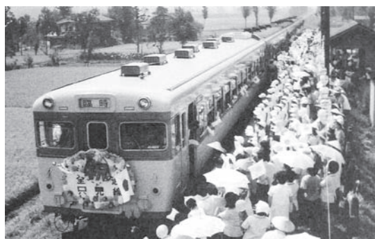
全線開通を祝う越後須原駅に集まった皆さん

小出と会津若松間をつなぎ、ひたむきに走行し続ける只見線と沿線の魅力をもう一度探ってみましょう。