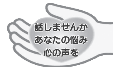
魚沼地域「命をまもる」自殺予防キャッチコピー

心の不調に気づきやすいのは、もっとも身近な存在の人です。早期に適切に対処すれば、回復も早くなります。“あなたは決してひとりではない”という声かけと見守りが大切です。相談されたら話をじっくり聴き（傾聴）、相手の気持ちに寄り添うことを心がけましょう。