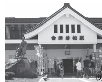
終点の会津若松駅。入口には有名な会津藩“白虎隊”の像が出迎えてくれます。