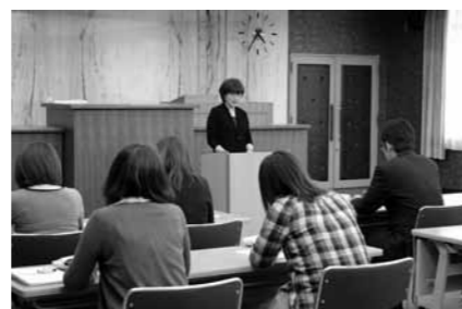
平成24年5月 新人職員研修会の様子