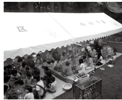
むかいまつかわ 向松川区 (守門地域) 太鼓やテント、集会所のテレビ等を整備しました。