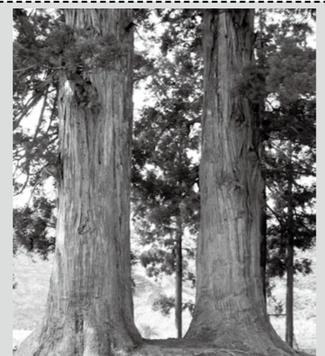
迫力ある滝之又の二本杉。滝之又地区のシンボリック的存在です。

トルの所に正心寺という寺院があり、その山門の杉であったともいわれています。 ※目通りとは、地上高1.2メートルで測った樹木の幹の周長のことです。