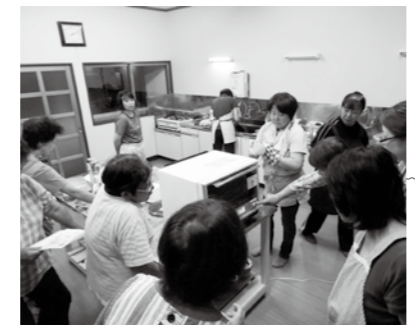
あかつち 赤土区 (守門地域) 集会所のエアコンやテレビ、レンジ等を整備しました。