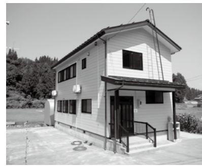
うおのじ 魚野地区 (堀之内地域) 老朽化したコミュニティセンターの建て替えを行いました。

宝くじ助成事業を活用し、今年もコミュニティ活動への助成が4地区に対して行われました。 助成を受けた区では、整備した集会所や備品を活用して地域コミュニティの活性化を図ります。