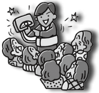
国民生活センター「見守り新鮮情報第4号」より引用

業者の巧みな話術に乗せられて、温熱治療器や寝具類などの高額な商品を買わされてしまったという相談が寄せられています。特に高齢の方が対象となる傾向があります。「無料配布」、「格安」などと誘われても、安易に会場に行かないように注意しましょう。