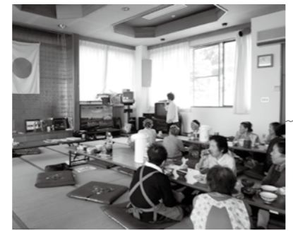
よこね 横根区 (八広瀬地域) 集会所のテレビやコピー機、テーブル等を整備しました。