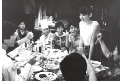
ぼくらの七日間戦争 (宮沢りえ ほか)