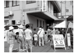
毎年小出商工会前には行列が。家族での来場が多いようです。

■今年で13回目を迎えました チャレンジマップスーパーセールは、約50日間の売り出し期間を設け、豪華賞品が当たる抽選会を行います。今年も小出地域を中心とした133店舗が協賛し、抽選本数はなんと20,000本以上。毎年楽しみにしている方も多く、13回目となった今年も、抽選会場は親子連れなどで賑わいました。