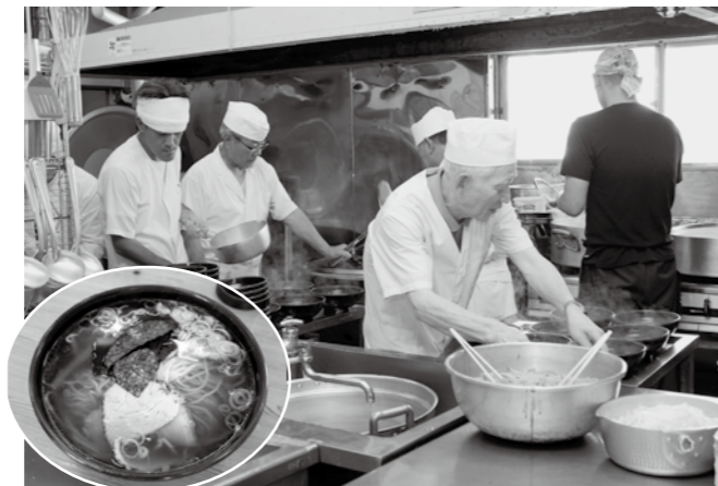
名店がタッグを組む、歴史ある慰問事業 — 9.19 魚沼更生園ラーメン慰問

今年で51回目を迎えたこのラーメン慰問事業。主に小出地域の麺業組合に加盟しているラーメン店・蕎麦店の皆さんが協力し、魚沼更生園でラーメンを振る舞います。力を合わせて作った渾身の「あっさり系しょうゆラーメン」は入所者さんに好評でした。