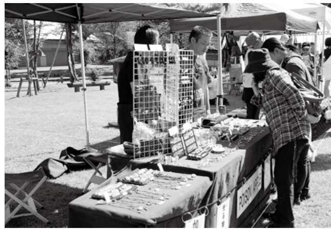
個性的な一品、ぜひ見て行って — 9.28 うおぬま手もんづら市クラフトフェア in 大湯温泉

奥只見レクリエーション都市公園「大湯公園」で開かれた手もんづら市に、今回は市内外から46店舗が出店しました。東京都や静岡県、兵庫県など遠方からの出店者も多く、オリジナリティに溢れた作品を持ち寄って、お客様の目を楽しませていました。