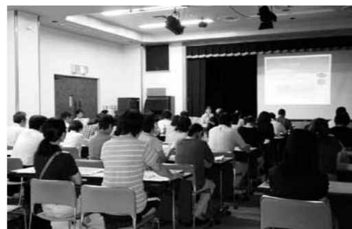
職員向けメンタルヘルス研修会の様子