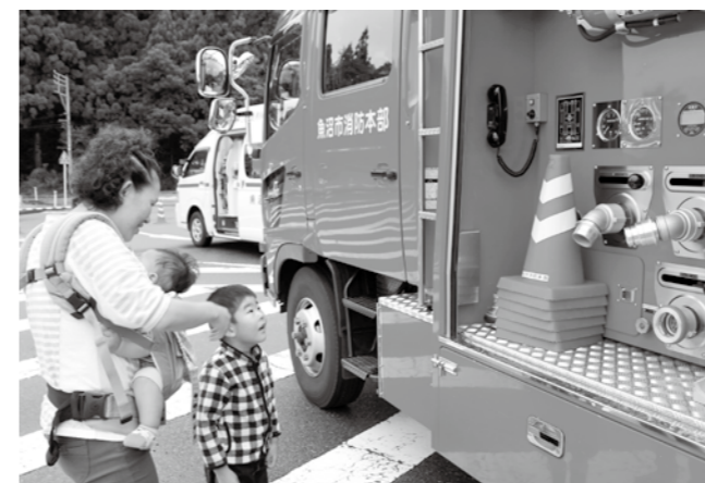
「うわあ、近くでみるとかっこいいね〜！」 — 9.8 消防フェスタ

9月9日の「救急の日」にあわせ、魚沼市でも小出郷文化会館で「消防フェスタ」が行われました。会場には消防車や救急車などの緊急車両も登場。間近で消防車を見た子どもは目を輝かせながら車両に見入っていました。