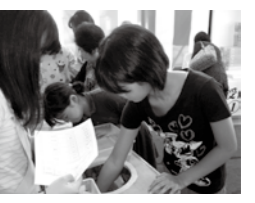
ドキドキワクワクの抽選会。なにが当たるかな？

の方の協力で開催されるこのイベントは、1年間会議を重ねて開催されます。魚沼地域の商業が元気になるよう、1店舗での買い物だけでなく、複数のお店をまわってもらえるように、仕組みづくりの工夫をしています。