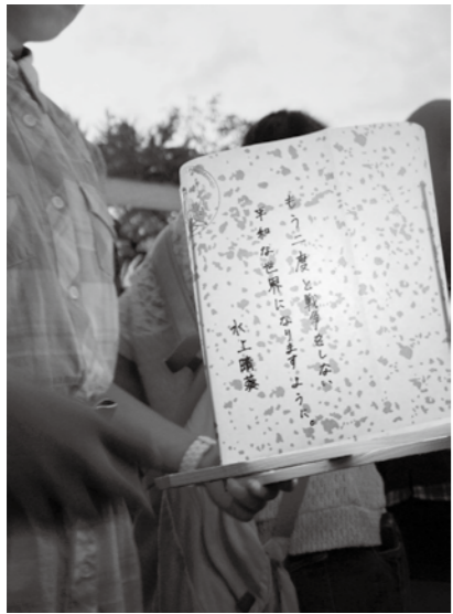
広島市の元安川に、平和への祈りが込められた灯籠が流されました

なく、今年、広島に原子爆弾が落とされたから、68年を迎える。今までテレビ等でしか知りえなかった広島の実態を、私は、広島平和記念式典に出席し、体験することができた。世界各国、日本各地から人々が集まり、会場内は、緊張感に包まれていた。式典の中で、いろいろな話を聞き、広島の人々の体験談は、あまりにも悲惨で本当に辛い出来事だった