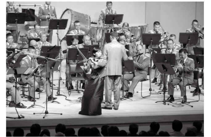
毎年聞きたくなる迫力の音色 — 9.7 陸上自衛隊第12音楽隊メモリアルコンサート

自衛隊の音楽隊コンサートは、中越大震災の翌年から復興を祈念して開催され、以後毎年行われています。小出郷文化会館の大ホールは今年も満員御礼。来場者は音楽隊の最高の演奏に聞き入り、2回のアンコールにも応えた音楽隊に、大きな拍手を送りました。