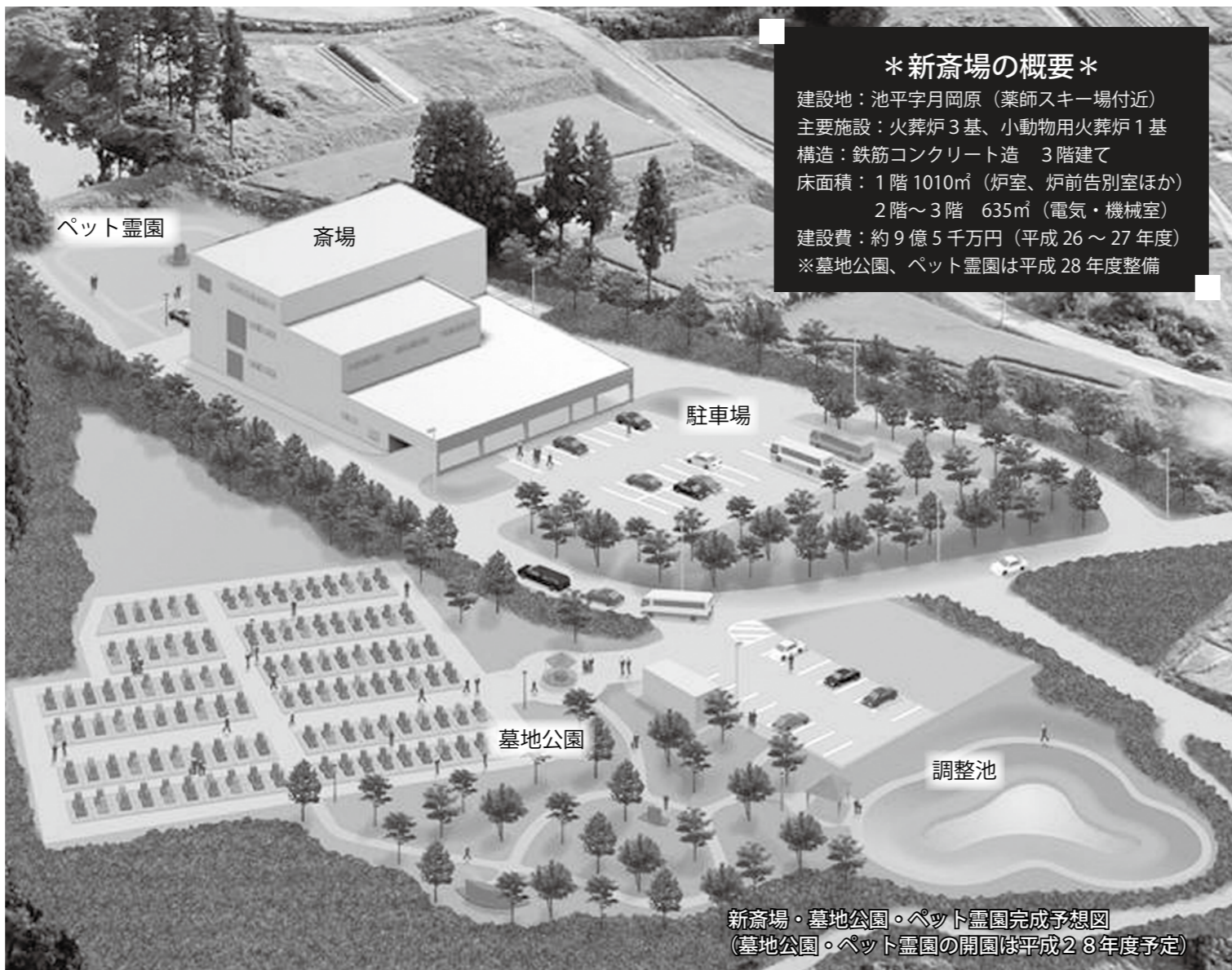
新斎場・墓地公園・ペット霊園完成予想図 （墓地公園・ペット霊園の開園は平成28年度予定）

*新斎場の概要* 建設地：池平字月岡原（薬師スキー場付近） 主要施設：火葬炉3基、小動物用火葬炉1基 構造：鉄筋コンクリート造 3階建て 床面積：1階 1010㎡（炉室、炉前告別室ほか） 2階～3階 635㎡（電気・機械室） 建設費：約9億5千万円（平成26～27年度） ※墓地公園、ペット霊園は平成28年度整備