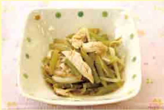
ふきのサラダ (副菜)