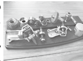
新潟工場で作られている刈払い機やチェーンソーなどの部品

「感謝・情熱・創造を3社是として取り組み、お客様のニーズにお応えできるものづくりに専念していきたい。」と話してくれました。