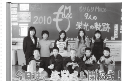
東湯之谷小学校が閉校（3月31日） 最後の卒業生9名と、在校生32名が新たな道を歩み始めた日となりました。