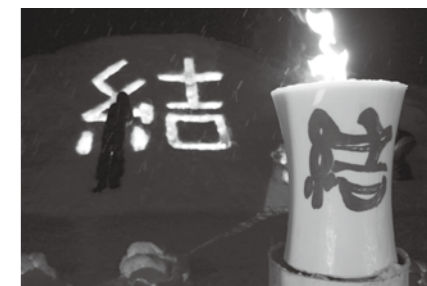
「結の灯り」点灯式（1月15日） チェリッシュのお二人も駆けつけ、魚沼市民の歌「魚沼元気」を歌ってくださいました。