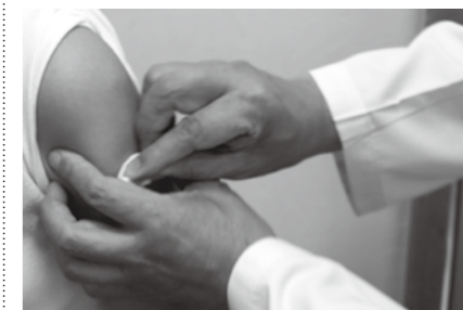
子宮頸がん予防ワクチン接種開始（6月1日） 中学1年の女子を対象として始まった予防接種。全国でもいち早く、全額公費での実施案を打ち出しました。