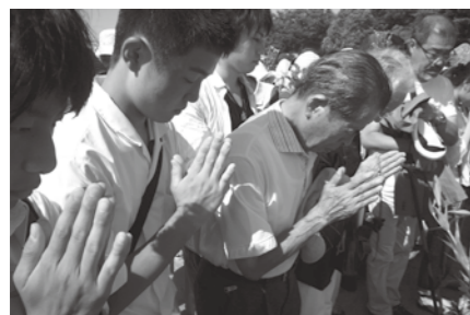
中学生6名、広島へ派遣(8月5日) 5日～7日まで、市内6中学校からの代表者と市長などで広島の平和記念式典に参加してきました。