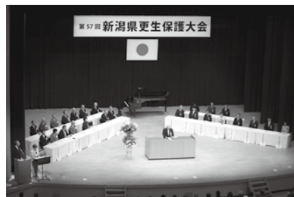
新潟県更生保護大会が魚沼市で開催(10月22日) 県内で、保護司として日々尽力されている大勢の方々が、文化会館で表彰を受けました。