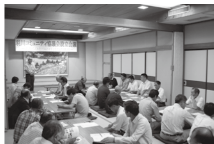
コミュニティ協議会設立(7月14日) 市内各地でコミュニティ協議会が設立されました。(写真は羽川コミュニティ協議会設立総会)