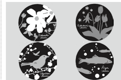
市のロゴマークが決定（3月1日） 多くの応募作品の中から選ばれた作品。各庁舎の看板にもお目見えしています。きれいな色使いが印象的です。