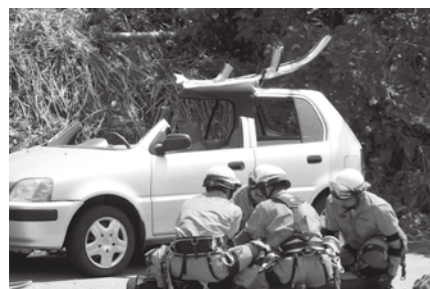
県と市の合同防災訓練(9月1日) 大規模な防災訓練で、多くのマスコミが魚沼市を訪れました。