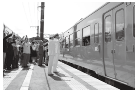
小出駅竣工式典と、只見線全線開通40周年記念イベントでは、オレンジ色の只見線が市内を走り抜けました。