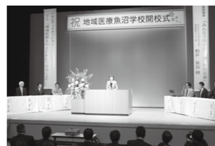
この日の開校式から、健康を守るための講演会等が市内各地で開催されました。