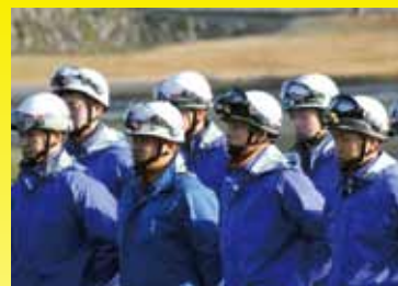
緊張感を持ち、真剣な表情の隊員