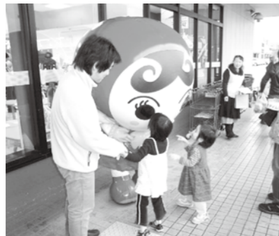
人権啓発週間の街頭活動（12/4）

人権とは、私たち一人ひとりが人間として、生まれながらにして有する当然の権利です。互いに相手を思いやり、自分の人権も相手の人権も大切に守りながら、ともに暮らせる社会を築いていきましょう。