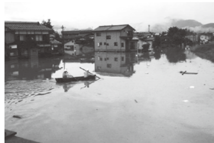
7月28日から降り続いた雨は、新潟県と福島県に甚大な被害をもたらしました。【平成23年7月新潟・福島豪雨】