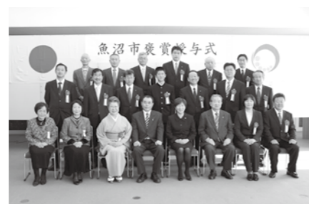
市内外で、表彰状授与19名（団体）、感謝状贈呈6団体となりました。皆さんおめでとうございました。