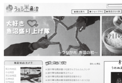
魚沼市内の観光や食に関するサイトが開設しました。穴場が見つかるかも。 http://www.welcome-uonuma.com/