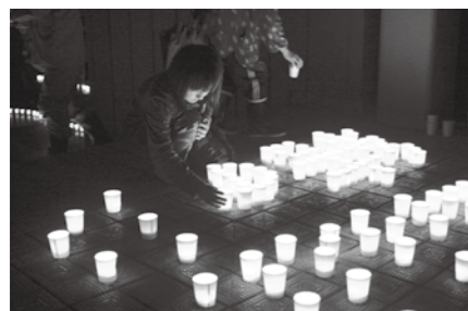
新潟県中越地震から7年目を迎え、結の明かり点灯式は広神西小学校をメイン会場として行われました。