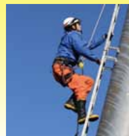
高所は注意しながら、かつ迅速に。