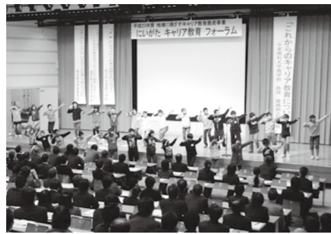
実践発表で魚沼市を宣伝する須原小の児童。大勢の前で踊りを披露しました。