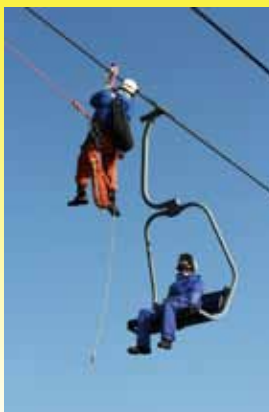
地上からは6mの高さ!

魚沼市では、スキーリフトの緊急停止による救助活動事例は数えるほどしかありませんが、いざという場合に備え、隊員たちは訓練に励んでいました。