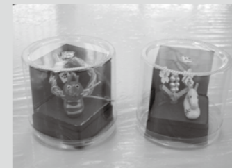
新作デザインも加わり、今年の新作「辰」もかわいらしくできました。

一つ一つ作業を覚えながら、一生懸命に取り組んでいます。心を込めて作るクッキーをぜひ一度ご賞味ください。