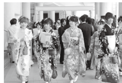
魚沼市内で446名が新成人となりました。(式典参加360名)