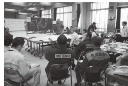
最大深度4mを超える豪雪に見舞われた2月。自衛隊が入広瀬地域で活動。