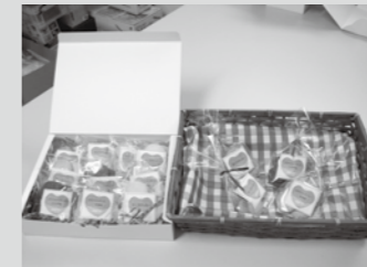
単品から詰め合わせまで可能。ご贈答用にいかがでしょうか。

また、なないろ開所と同時にスタートした事業がクッキー作りです。現在チーズ・黒ゴマ・ココア・紅茶の4種類がありますが、新作も検討中ですので楽しみにしててください。市内の豆腐屋さんのおからが入ったものもあり、好評をいただいています。