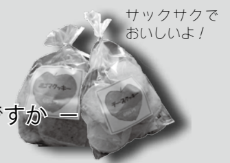
サクサクでおいしいよ!