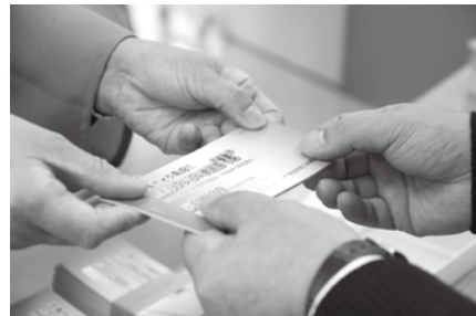
魚沼市プレミアム商品券“結”が10月に販売されました。11月16日に2万セット完売となりました。