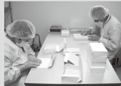
詰め合わせ用の折箱作りとシール貼り作業