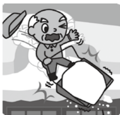
※北陸地方豪雪検討会「屋根の雪下ろし3つの用心」より引用