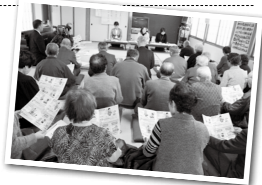
皆さんリーフレットを開き、興味深く講座に耳を傾けてくださいました。

悪質商法にはだまされなさいぞ！ 1月18日に根小屋地区の新田集会所で、消費者トラブルに遭わないための出前講座が開催されました。 この日集まったのは根小屋第一地区老人クラブの皆さん。 消費者トラブルに関するリーフレットが配られると皆さん興味深そうに一読され、講師の消費生活サポーター（※）の話の聞きながら聞き入っていました。 また、高齢者が陥りやすい契約トラブルを魚沼弁を交えた寸劇でわかりやすく表現したり、悪質商法の断り方