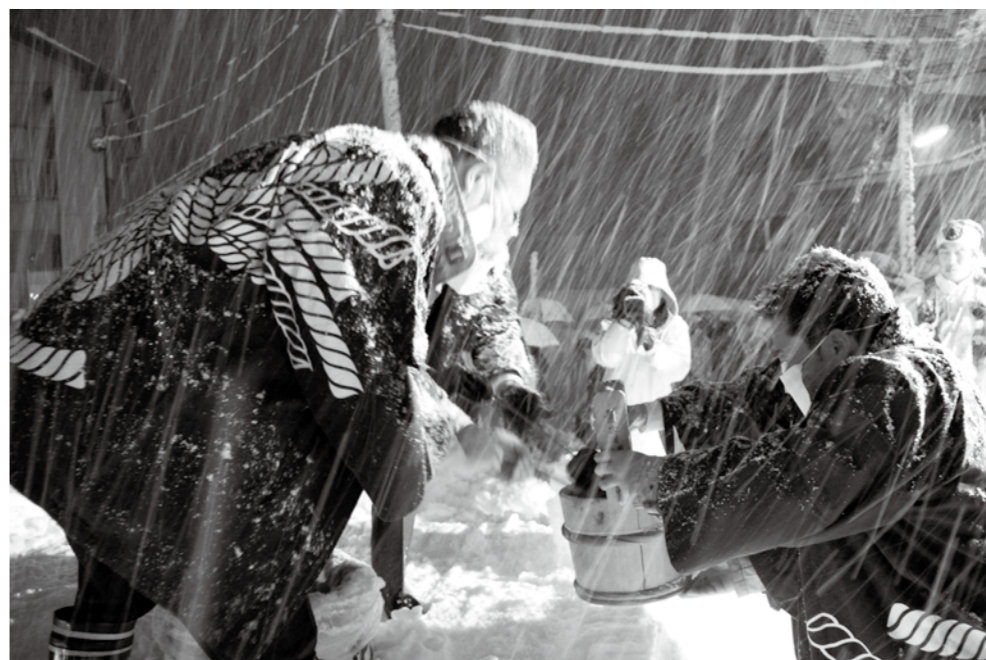
極寒の中での「若水取り」