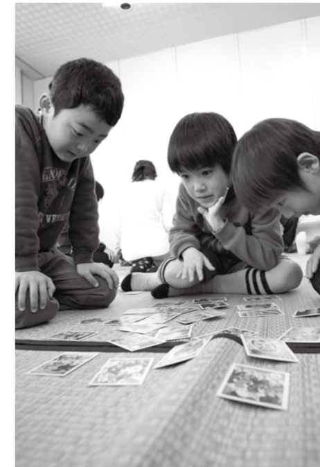
あまぎはくあまぎまへまで十二溝 1月20日 おらが広神いろはがるた

手作りキャンドル教室が魚沼交流ネットワーク『つなごて』で行われました。この日作られたのは、スイーツをイメージしたバレンタインキャンドル。白いロウを溶かしたものは、まるで本物の生クリームのように、かわいいキャンドルがたくさん出来上がりました。