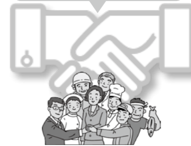
お互いに契約を守る義務が生じます