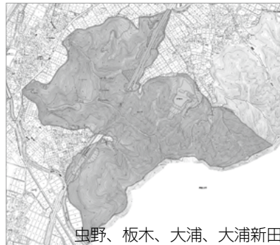
虫野、板木、大浦、大浦新田