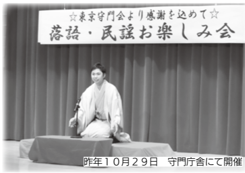
昨年10月29日 守門庁舎にて開催

「誰が聴いても分かりやすい面白い落語」をテーマに、魚沼特使「柳家吉緑」による独演会を開催します。この機会をお見逃しなく。 日5月1日(火)19時から ※開場：18時30分 場守門庁舎 ¥500円 関守門公民館 ☎797・2261