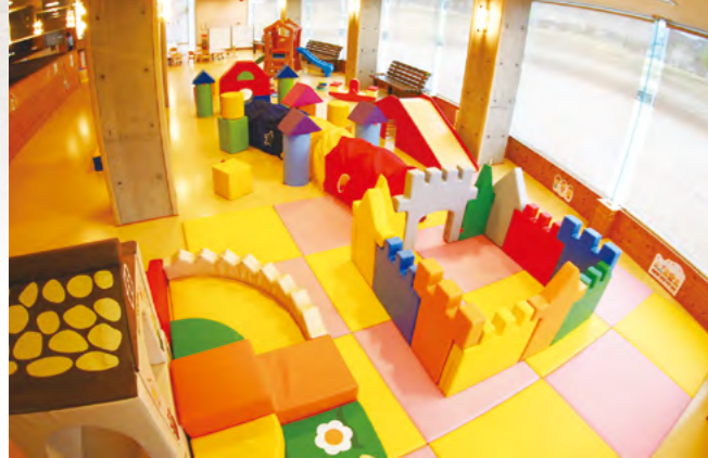
2階 乳幼児活動スペース