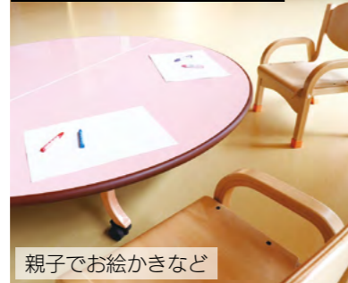
2階 乳幼児活動スペース