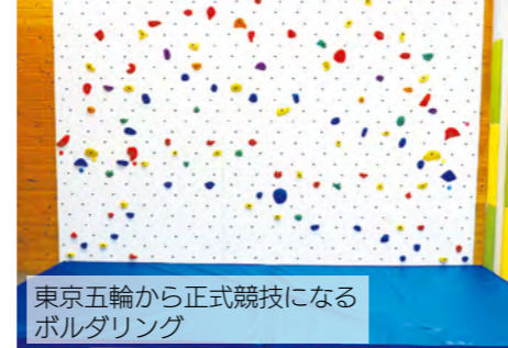
1階 子ども活動スペース