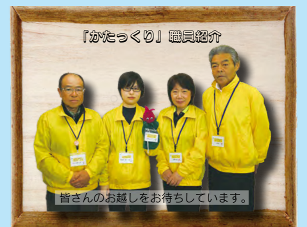
「かたっくり」職員紹介

◆利用時間：9時30分～18時30分 ◆利用料金：無料 ◆休館日：月曜日（祝日の場合は翌日） ※第2期工事（9月以降予定）の期間中は、施設を休館する予定です。