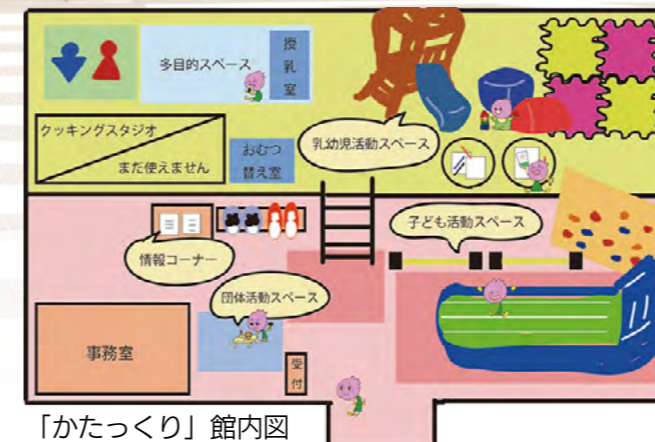
「かたっくり」館内図