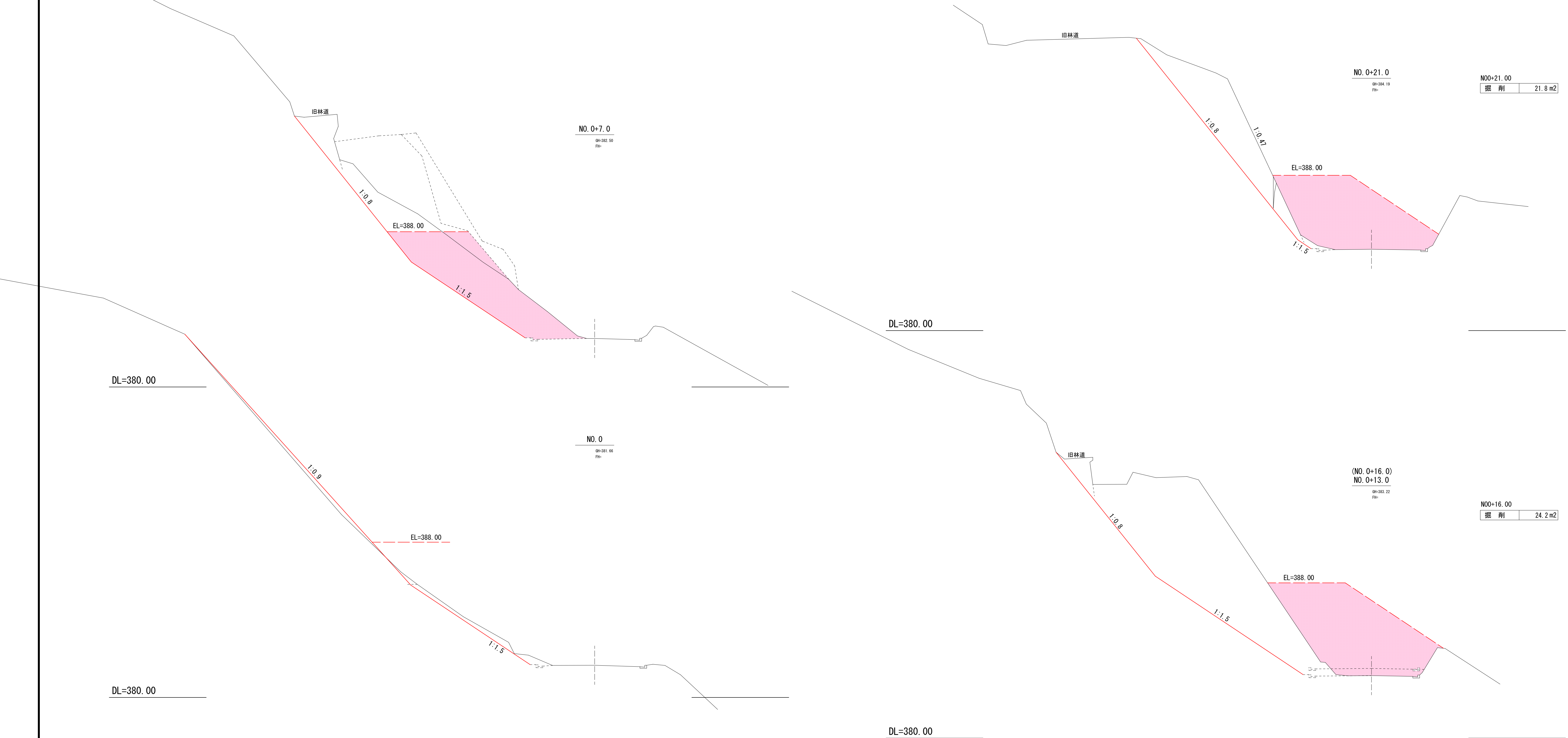
林道権現堂南線現道縦断面図