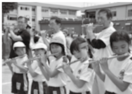
地域伝統芸能「大の阪」 堀之内小学校

10月に行われる「広神ふれあいまつり」では、中学生の代表が企画から加わり準備を進めます。広神西小・広神東小・広神中のブースが並び、中学生はテントの設営、販売、ステージ発表、相撲大会などの手伝いをします。子どもが地域の大人とともにイベントに携わることで、子どもの成長と地域の絆が育まれています。