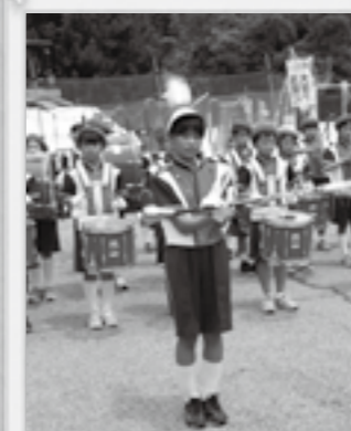
湯之谷小学校 鼓笛隊の演奏