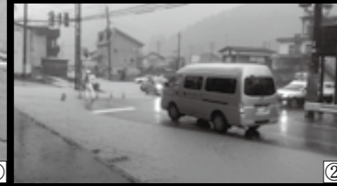
①日付川の護岸損傷により水田へ土砂等が流入した(米沢) ②冠水したR352号を走行する車(大沢)

7月16日(火)、市内に短時間で記録的な大雨が降り、湯之谷地域や広神地域では建物への浸水や田畑への土砂流入等の被害がありました。