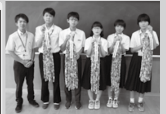
皆さんから寄せられた折り鶴を平和への願いとともに広島に届けてきました。