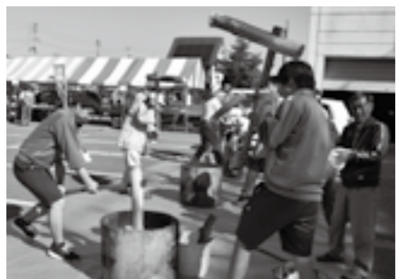
広神ふれあいまつり 広神中学校

10月に行われる「広神ふれあいまつり」では、中学生の代表が企画から加わり準備を進めます。広神西小・広神東小・広神中のブースが並び、中学生はテントの設営、販売、ステージ発表、相撲大会などの手伝いをします。子どもが地域の大人とともにイベントに携わることで、子どもの成長と地域の絆が育まれています。