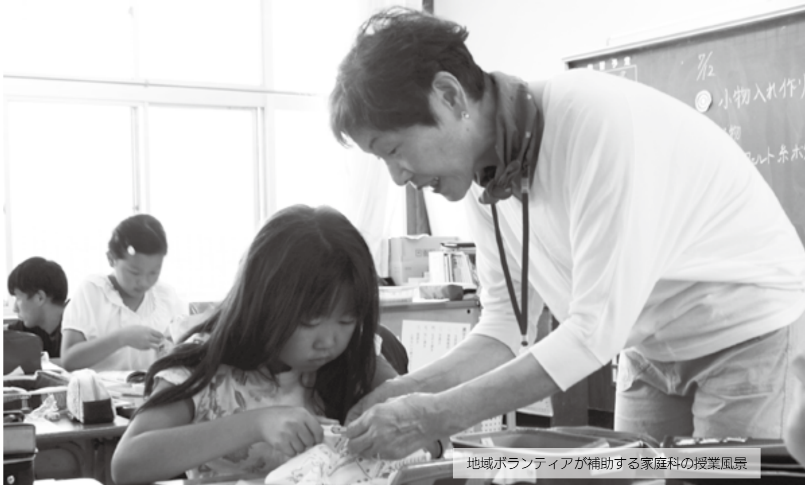
地域ボランティアが補助する家庭科の授業風景