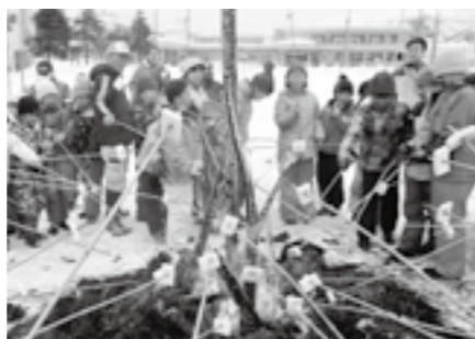
さいのかみ 塞ノ神 須原小学校

5年生の家庭科の授業で「裁縫」や「ミシン縫い」の授業補助をします。授業のたびにボランティア登録している方へ案内を出し、都合のつく時にお手伝いに来てもらいます。作業の確認や作品づくりに関する質問に答えるなど、地域ボランティアがいることで授業の習熟度が上がり、教育の充実につながっています。