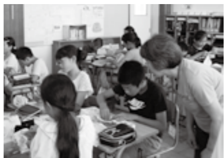
家庭科授業補助 小出小学校

運動会や芸能祭などで、国指定重要無形民俗文化財の「大の阪」を披露しています。歌や笛、太鼓に踊り、大の阪の会の方の熱心な指導を受けながら、地域の方の思い・温かさに触れ、わがまち堀之内のよさを子どもたちは実感しています。子どもたちにとって貴重な経験になるとともに、地域の活性化につながっています。