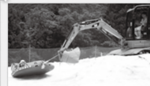
このイベントでしか楽しむことができない SSS サマースノースライダー