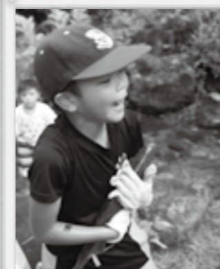
魚のつかみ取り レインボーハンティング