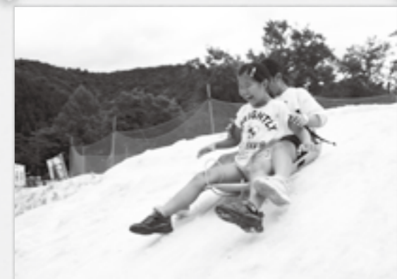
子どもたちの歓声が響く 雪山のソリ遊び

夏の恒例行事である「うおぬま夏の雪まつり」は、蒸し暑い2日間でしたが天候にも恵まれ、涼を求める多くの人で賑わいました。