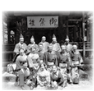
宝くじ助成事業で整備した備品による活動の様子

場小出ボランティアセンター ◎堀之内地域 日 10月30日(水)19時から 場堀之内公民館 ◎企画政策課 ☎792・1425 ◎魚沼市議会定例会 一般質問ラジオ放送 魚沼市議会では、FMうおぬま(81.4MHz)で定例会一般質問の放送をしています。令和元年第3回定例会を現在放送中ですので、ぜひお聞きください。 ◎ラジオ放送日 期 9月23日(初月)～10月4日(金) (土日除く) ・放送時間：14時からおおむね1時間※同日19時から再放送 ◎編集編 ・前の週に放送した分を編集編として日曜日に放送します。 日 9月29日(日)、10月6日(日) ・放送時間：10時からおおむね4時間 ◎質問者の人数等により放送