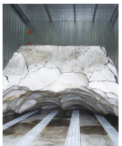
▲貯蔵量 300 トンの雪室 (空気循環式) 冷気をカカオ豆熟成用の貯蔵庫に送っています。