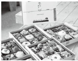
「縁むすび弁当」 加盟店ごとに中身が若干異なり、どのお店が当たるかは、お楽しみ♪

皆様のご協力のおかげで、6月20日現在、197個をお届けできた。現在も販売中。今後は、駅弁や視察・観光の方への名物弁当としても、育てていきたいと計画している。 こんな時でも「今」を大事に、前進していきたい。