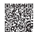
▲厚生労働省 ホームページ

◆ 小出病院皮膚科の受付 時間を変更しました 皮膚科の受付終了時間が14 時30分までに延長となりまし た。 ⑧ 小出病院 ☎ 792・2111 健康増進課 ☎ 792・9763