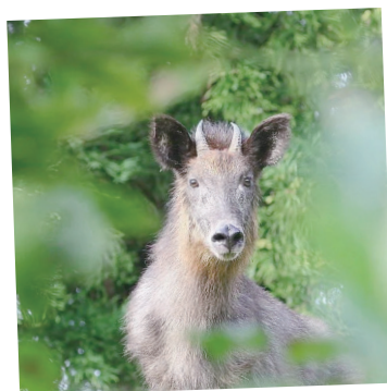
@blues_jamming 小出公園のカモシカ