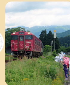
小出駅-大白川駅間80周年記念日の11月1日にも沿線で手をふってくださいね。