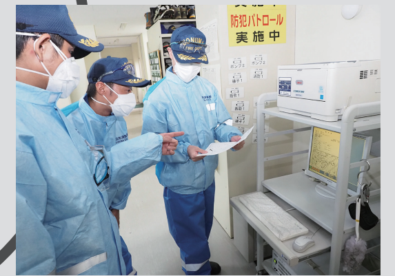
▲通信指令員が聞き取った住所などの情報を隊員が確認

状況にもよりますが、通報を受けてから約2分~3分ほどで出動します。隊員たちは直ぐに出動できるよう準備をしています。