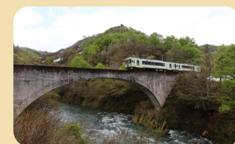
魚沼市では大白川にある第四平石川橋梁(写真)と六十里越トンネルが指定されています。

「日本土木遺産」とは、歴史的土木構造物の保存に資することを目的として、公益社団法人土木学会が平成12年に創設した認定制度です。