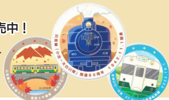
「だんだんど〜も只見線沿線元気会議」制作

魚沼市観光協会、道の駅いりひろせ、元気すもん等にて取り扱っています。 (魚沼市観光協会 ☎792・7300)