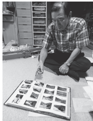
当時の写真を収めてあるアルバム。当時の写真はかなり貴重なものばかりです。

中学生になると、父親のカメラを使って只見線の写真を撮り始めたそうです。それは自分の興味という事だけでなく、只見線の姿を残したいという気持ちもあって、持ち続けていたそうです。「今思うと時の移り変わりが大切だと思う。当時撮影した写真は今も残っていて、アルバムに収めてある。只