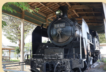
上ノ原児童公園に保管してあるSL(中には入れませんのでご注意ください)

小出郷福祉センター近くの上ノ原児童公園には、只見線を走っていた蒸気機関車C11 46が展示されています。昭和9年に製造され、昭和30年~昭和46年まで、小出駅-大白川駅間を走りました。