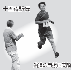
沿道の声援に笑顔