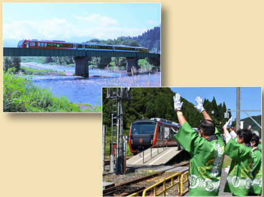
令和3年8月29日に運行された「只見海里」

小出駅から会津若松駅まで全線開通したのは1971年(昭和46年)。この頃から自家用車が普及し、移動手段が変化していきました。1973年(昭和48年)には只見線と並走して走る国道252号が開通しましたが、県境区間は冬期閉鎖するため、現在でも只見線が、冬の唯一の交通機関として担っています。