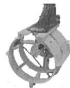
スクリューガード