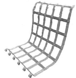
落水者リカバリーシステム