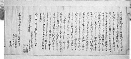
差上申一札之事 (八十里道茶屋滞留)