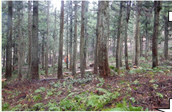
令和元年、間伐後の入広瀬50林班