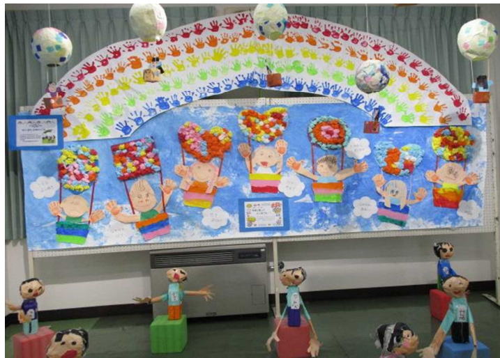
気球に乗ってどこまでも ばら組

今月は、伊米ヶ崎保育園の作品を展示します。テーマは「空・自然・大地」44名の園児たちが作成した小さくて可愛い作品を展示しています。