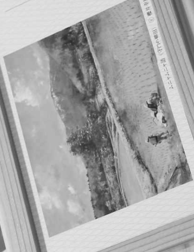
黒鉄の青の青い水、黒鉄の青の青い水