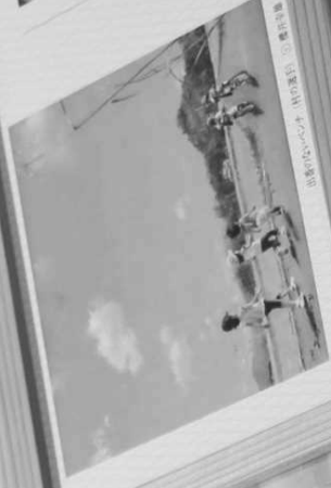
黒鉄の青の青い水、黒鉄の青の青い水