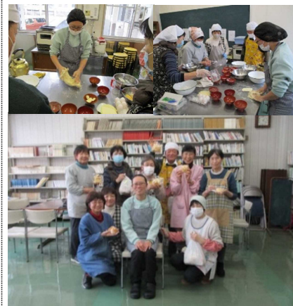
工房ラパン様よりプロの味

オーブンから焼きあがったメロンパンは思ったより大きく、パンの皮はサクサクし、ふわふわで大変美味しかった。「また、違うパンを習いたい。」との声も多く聞かれ、手づくりの良さを再発見した。(山田記)