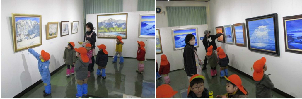
絵画を観賞する伊米ヶ崎保育園の園児たち