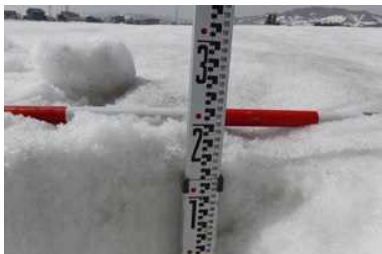
目盛が見える接写