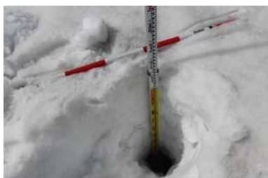
計測地の地面が見えるもの