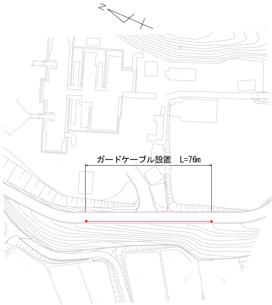
計画平面図 S=1 : 500