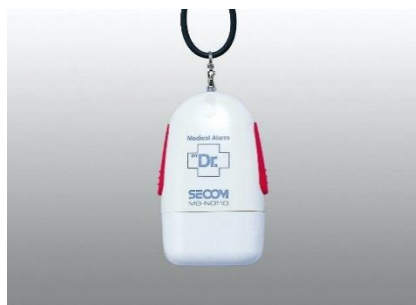
ペンダント式通報機器