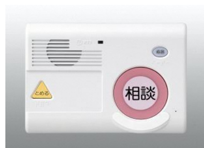
健康相談サービス