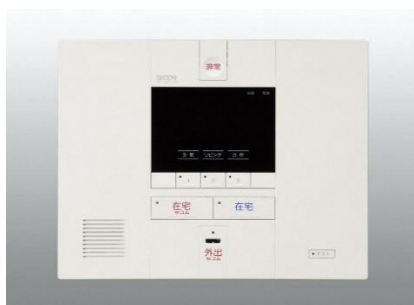
据え置き式通報機器