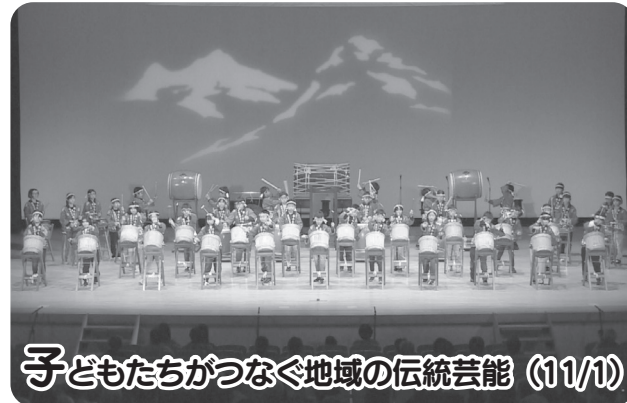
子どもたちがつなぐ地域の伝統芸能 (11/1)

紅葉に彩られた魚沼の山々を背景に、全国から参加した多くのランナーが市内を走り抜け、沿道からの温かい声援が大会を盛り上げました。