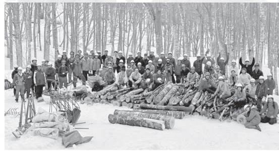
農林水産大臣賞、農林水産祭天皇杯受賞