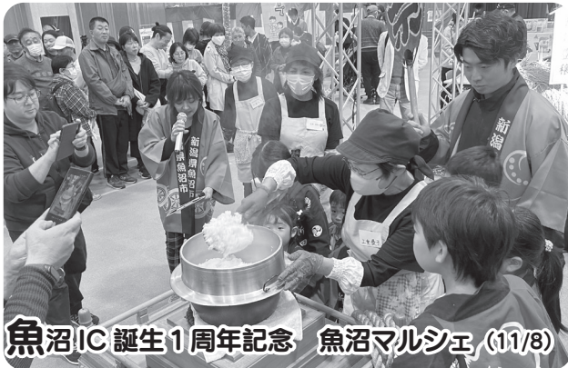
魚沼IC 誕生1周年記念 魚沼マルシェ (11/8)

魚沼インターチェンジ誕生1周年を記念したイベント「魚沼マルシェ」が開催されました。会場では、地場産品の出店や、お米一合の重さを当てる体験コーナーなどが行われたほか、炊きたての新米が来場者に振る舞われました。