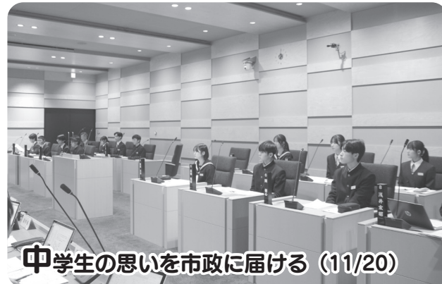
中学生の思いを市政に届ける (11/20)

子どもたちの感性を高めるとともに地域の伝統芸能を後世へ伝える「魚沼子ども芸能祭」が響きの森文化会館で開催されました。17回目を迎えた今回は、総勢200人を超える子どもたちが踊りや太鼓、昔語りなど様々な演目を披露しました。