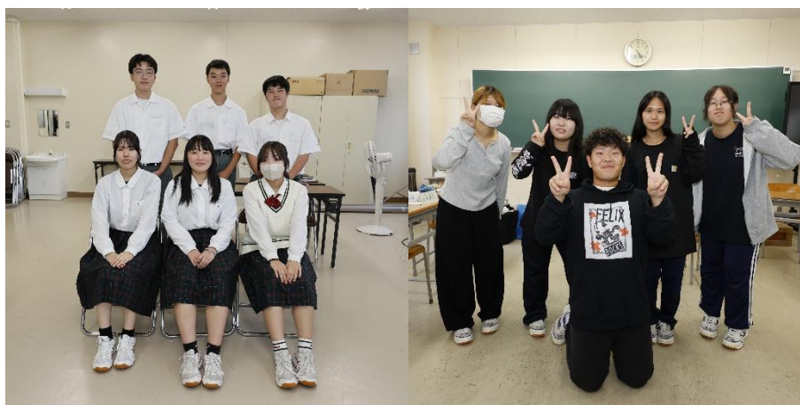
ヒアリングにご協力いただいた高校生の皆さん、ありがとうございました

そして、安心して子育てするためには、「子育ての駅かたくり」のような子育て支援施設が複数あることや自然体験ができるレジャー施設や親子で楽しめる屋内スポーツ施設を望む意見がありました。また、育児をする際の医療機関のサポートや企業の理解などの子育てしやすい環境を望む意見があげられました。