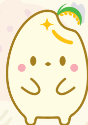
魚沼市公式キャラクター うおぬまっち

うお ぬま し きょういく い いん かい じ む きょく こ か 魚沼市教育委員会事務局 子ども課 ☎ 025-792-9201 ✉ kosodate@city.uonuma.lg.jp