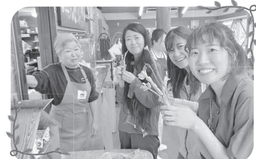
市外から来られた方々に山菜や地元食材の魅力を紹介