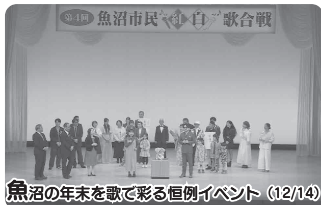
魚沼の年末を歌で彩る恒例イベント (12/14)

第4回魚沼市民紅白歌合戦が開かれ、小学生から80代までの男女16組が、紅組白組に分かれて自慢の歌声を披露しました。会場に集まった約480人の観客は、会場で配られたペンライトを振りながら熱い声援を送っていました。結果は紅組の勝利でした。