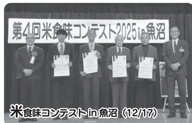
米食味コンテストin魚沼 (12/17)

飲酒の機会が多くなる年末にかけ、飲酒運転根絶を呼びかけるための飲食店等訪問活動が行われました。交通安全協会の役員などで構成された訪問班が市内の飲食店139店舗を回り、飲酒運転の危険性を訴えるポスター等を配布しました。