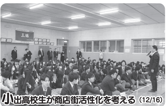
小出高校生が商店街活性化を考える (12/16)

高校生が地域への理解を深めるための探究学習が小出高校で行われました。市に派遣されている「地域活性化起業人」が講師となり、小出商店街の活性化をテーマに、3年生を対象とした全4日間のカリキュラムが行われました。最終日にはビジネスアイデアの発表会があり、生徒達からは「アートでまちおこしをする」「高齢者と若者が交流する場所づくり」などのアイデアが出されました。