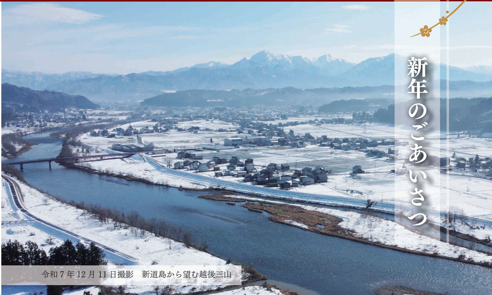
令和7年12月11日撮影 新道島から望む越後三山

謹んで新春のお慶びを申し上げます。また、市民の皆様からは、日頃より市政の進展に向けてご理解と協力を賜っておりますことに、深く感謝を申し上げます。