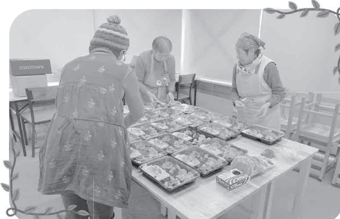
「元気すもん」感謝祭で提供するお弁当を準備中