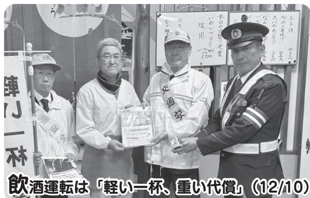
飲酒運転は「軽い一杯、重い代償」 (12/10)

第4回魚沼市民紅白歌合戦が開かれ、小学生から80代までの男女16組が、紅組白組に分かれて自慢の歌声を披露しました。会場に集まった約480人の観客は、会場で配られたペンライトを振りながら熱い声援を送っていました。結果は紅組の勝利でした。