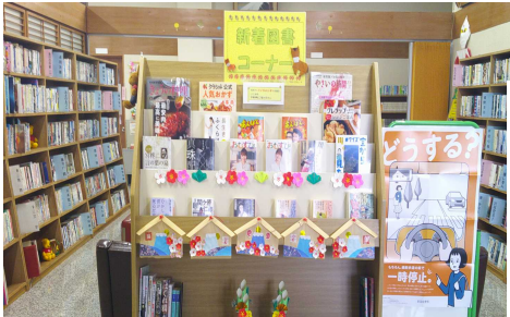
エレベーターを降りると新刊図書コーナー