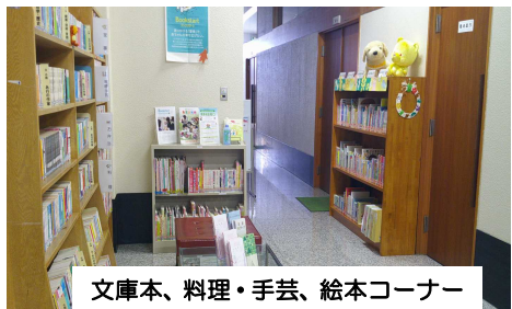
文庫本、料理・手芸、絵本コーナー