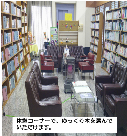
休憩コーナーで、ゆっくり本を選んでいただけます。