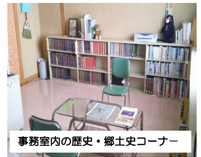
事務室内の歴史・郷土史コーナー