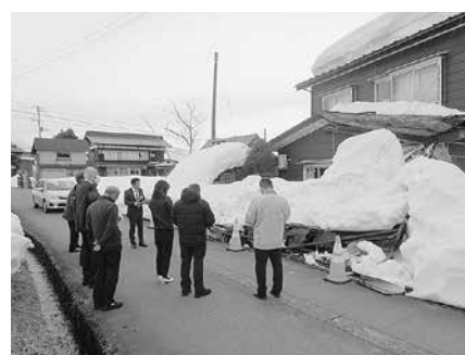
大雪による空き家の状況について 現地調査

④ 現地調査・総括 大雪による空き家等の状況について、現地調査及びその総括を行った。