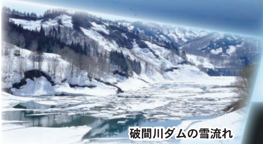
破間川ダムの雪流れ