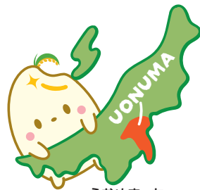
魚沼市公式キャラクター うおぬまっち