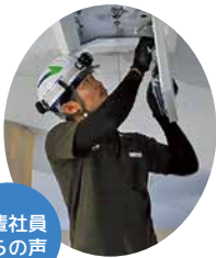
先輩社員からの声

少人数の会社ですが、だからこそみんなの仲が良く働きやすい環境だと思います。他業種からの転職でも、わからないことは丁寧に説明しながら作業するので心配りません。また、資格取得に関わる費用も会社負担で挑戦しやすく、合格すると給料がアップするのでとても励みになります。建設業のいわゆる3K(キツイ・汚い・厳しい)を徹底的に根絶しようと考えているので、自分の能力をどんどん生かして伸び伸び働ける点が当社の自慢できるポイントです。