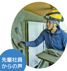
先輩社員からの声

以前は地元の工務店で設計補助等のパソコン作業でしたが、左官の格好良さに惹かれ26歳で飛び込んだ女性左官士です。気が付いたらもう9年生。入社して5、6年目で1級左官技能士と2級タイル張り技能士を取得しました。先輩・後輩みんな仲が良く、仕事の相談やフォローもしやすい、働きがいのある職場に助けられています。10時3時のおやつタイムも大切にしながら、これからも仲間と力を合わせて楽しく頑張っていきたいです。