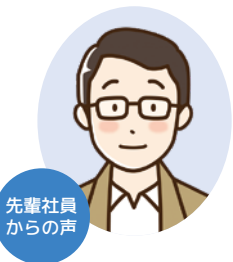
先輩社員からの声

快適な生活空間を創り上げる建設業という仕事にやりがいを感じ、誇りを持っています。また先輩方から豊富な経験を学び、実践する楽しみもあります。最近は新しい技術を駆使しています。私たちと一緒に働く皆さんを待っています。