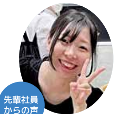
先輩社員からの声

就職の決め手は人の雰囲気良かったからです。会社の見学に行った際、皆さん気さくに話しかけてくださったり、社員同士が笑顔で話しているところが印象的でした。