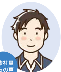
先輩社員からの声

子供の発熱などの突発的な休みでも快く休ませていただけて有難いです。仕事と子育てを両立しやすい職場だと思います。