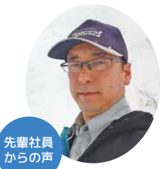
先輩社員からの声

担当/森林部 森林管理課 ☎ 025-797-2142 ✉ uonuma-shinrin@ah.wakwak.com