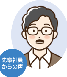
先輩社員からの声

様々な手当や資格取得の補助など福利厚生が充実していて、有給休暇の取得もしやすいなど働きやすく、アットホームな職場だと思いました。一緒に働くなかで、資格や技術を身に付けて、自身のレベルアップを図り、暮らしやすい地域づくりを目指していきましょう。