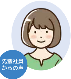
先輩社員からの声

創業から57年。橋・屋根・学校・そして皆様のお宅家を塗り続けて来ました。そして社員は皆、有資格者です。指導員免許持っています。資格が取れるまで会社が全面サポートしています。初めてでも大丈夫！資格が取れるまで教えます。会社の中はいつも「ワハハ、ワハハ」と笑い声が絶えなくて賑やかです。