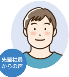
先輩社員からの声

建設業は、各種法令により何をするにも資格が必要になっていますが、会社が取得から実地までサポートしてくれます。