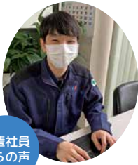
先輩社員からの声

スーパーゼネコンとの直接取引や官公庁からの受注により、安定した黒字経営を維持しています。一人ひとりの自主性を尊重し、若手の意見もどんどん採用しながら共に会社をつくっています。また、転勤せず地元で働きたい人には「専任職」、東京支店への転勤を了承する人には「総合職」をセレクトできます。資格に関しても会社が全力でサポートしており、実技練習の道具や資材提供。休日数も建設業としては画期的な120日越えとなります。