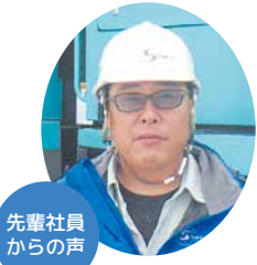
先輩社員からの声

土木工事のうち保守業が年間を通して継続した受注があり、安定した仕事が見込めます。地域に携わる人の生活と自然を切磋琢磨して磨き上げた社員の技術で環境づくりに取り組んでいます。