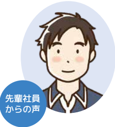
先輩社員からの声

当社は、ドローンやGNSSなどの最先端技術を駆使し、高精度で効率的な測量サービスを提供しています。技術力の向上だけでなく、社員一人ひとりの成長を大切にする環境を整備。資格取得支援や新技術研修を通じて、常に最新スキルを習得できる機会を提供しています。また、完全週休2日制や長期連休、有給休暇の柔軟な取得体制を整え、ワークライフバランスの実現にも力を入れています。