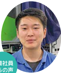
先輩社員からの声

この会社で作った製品は日本はもとより、世界 26ヶ国地域で使用されているグローバルカンパニー。日本及び世界の産業界を支えている企業です。特に自動車、金型、電機、工作機械、建設機械、医療機械、飛行機、造船等々。海外研修制度があり、国際感覚で仕事をしています。魚沼初の充実した社内フィットネスジムが有り、心身ともに健康を目指しています。