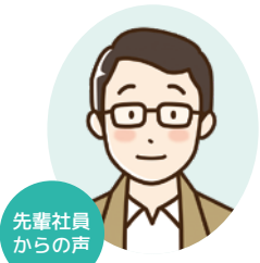
先輩社員からの声

当社は今年4月で創業55年になります。この間、下水道用マンホールによる水環境の保全や、消雪パイプブロックの散水で冬期間の道路交通の安全確保などに微力ながら貢献させて頂いております。また、近隣の学校や消防署、病院、庁舎建設などに当たってもお手伝いをさせて頂くことができました。今後も地域の安全、安心、防災、減災などによりいっそうお役に立ちたいと考えております。