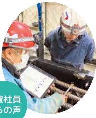
先輩社員からの声

“魚沼で超高層ビルを創る会社”です。熟練技術者による設計から製造まで社内一貫対応ができる強みを持っています。また、品質管理では自社開発により管理システムをDX化し、全社員がリアルタイムで情報を更新・共有しています。これにより作業量の最適化、早期トラブルの発見や、蓄積・可視化したデータの活用による効率化・省力化が可能となりました。このシステムは同業の大手企業からも高い関心を寄せられ、工場見学にお越しいただいています。