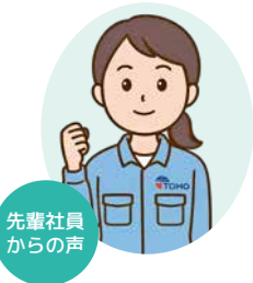
先輩社員からの声

2025年4月入社(女性) 私はプリント基板製作の「後工程」ではんだ付けを行っています。集中力が必要な作業ですが楽しい仕事です。職場の雰囲気が明るく先輩方も優しいので分からない事など気軽に聞ける職場です。