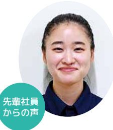
先輩社員からの声

★多様な働き方・キャリア形成によって、柔軟な働き方ができる ★未経験でも安心して働ける職場づくりに取り組んでいます 私は業務部に所属しています。家庭と仕事の両立に苦しんでいましたが、カイセ工業に勤めてからは柔軟な働き方ができることで、楽しく働くことができています。 人と人が直接かかわる部門なので、つながりを大切にしています。 入社後は研修があり、希望も聞いてもらえるので未経験でも安心でした！