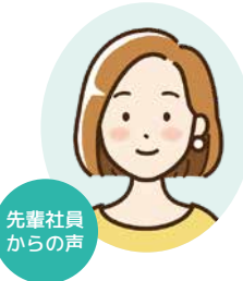
先輩社員からの声

品質管理課として、主に不具合の対応・改善、作業指導書の作成などの仕事を行っています。 ものづくりに関わりたくてこの仕事を選びましたが、実際一つの小さな部品をつくるのに、材料の発注から機械のメンテナンス、検査、梱包作業など、本当に様々な人が関わっている事を実感し、日々ものづくりの重みと面白さを感じています。