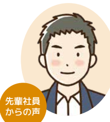
先輩社員からの声

スマート農業を目指し、圃場管理システムや栽培管理支援システムなどを使って圃場を管理しています。