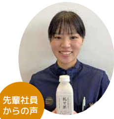
先輩社員からの声

令和3年4月入社(女性) 工場に併設されているカフェには魚沼醸造で作られた商品をアレンジして作られているメニューがいっぱい! また、工場では見たことのないくらい大きい機械が多く、その機械を扱う仕事はやりがいや達成感を感じることができます。 先輩後輩ともに仲良く、仕事も楽しいです!