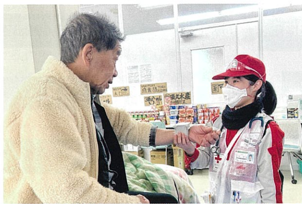
新潟県支部救護班による能登半島地震での医療活動