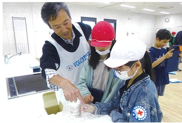
子どもたちへの防災教育

日頃から日本赤十字社の活動にご理解とご支援をいただき、心から感謝申し上げます。 日本赤十字社は「人間のいのちと健康、尊厳を守る」という赤十字の使命に基づき、災害救護を始め、昨今の防災ニーズに応えられるよう、自治会・町内会やコミュニティ協議会等を中心とした防災減災活動や、学校と連携し子どもたちへ防災教育などをお住まいの地域や当支部で実施しております。