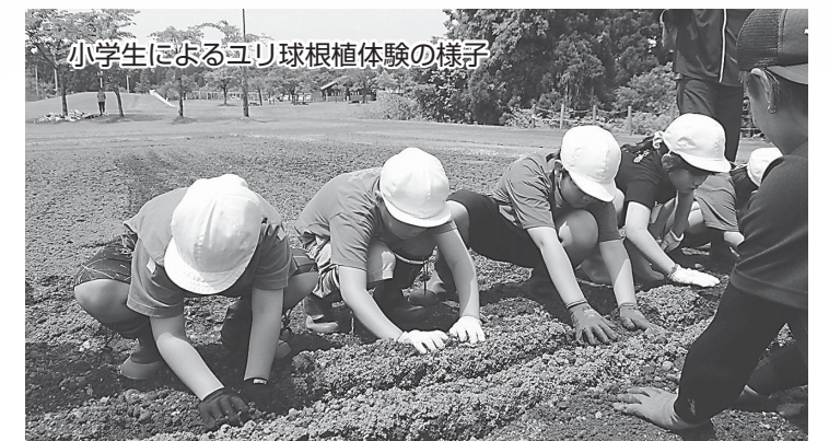
小学生によるユリ球根植体験の様子