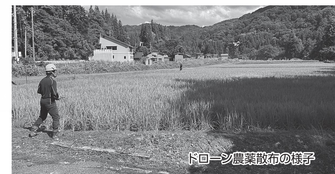
ドローン農薬散布の様子

★他の事業や各制度の詳細は、魚沼市のホームページから「ページID」で検索できます