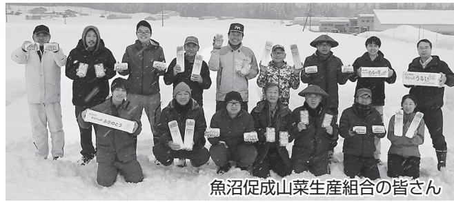
魚沼促成山菜生産組合の皆さん