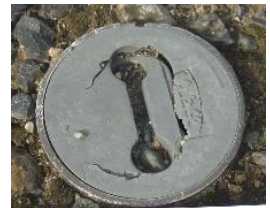
壊れた汚水ますのふた

壊れたふたなどの隙間から雨水が流れ込むおそれがあるため、見つけた場合は修理をお願いします。