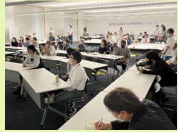
各グループ代表者の発表を聞いている様子