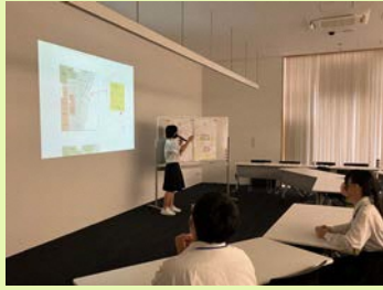
Eグループの代表者による発表の様子