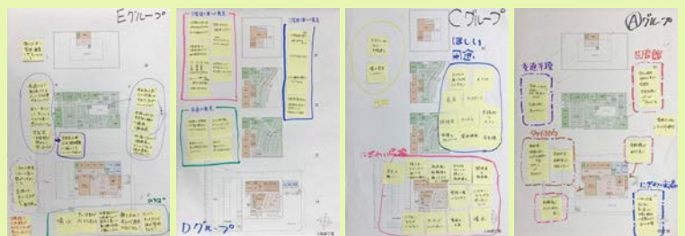
テーマ1をまとめたワークシート