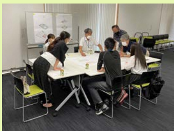
Cグループの議論の様子

図書館と公民館が明確に分かれていることで、どのグループからも、管理や機能性を考慮すると2階建て案の方が合理的であるという意見があげられました。しかし、図書館内にある学習室が、図書館閉館後に使用できなくなる点や、安全面から吹抜けは不要という点がデメリットとしてあげられました。また、3階建て案にある「段状書架」がなくなるため、特徴のない建物になるのではないかと、意見もあがりました。