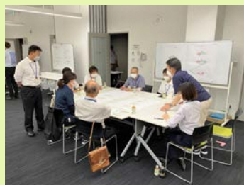
Aグループの議論の様子