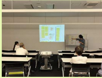
Dグループ代表者による発表の様子