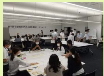
ワークショップ全体の様子