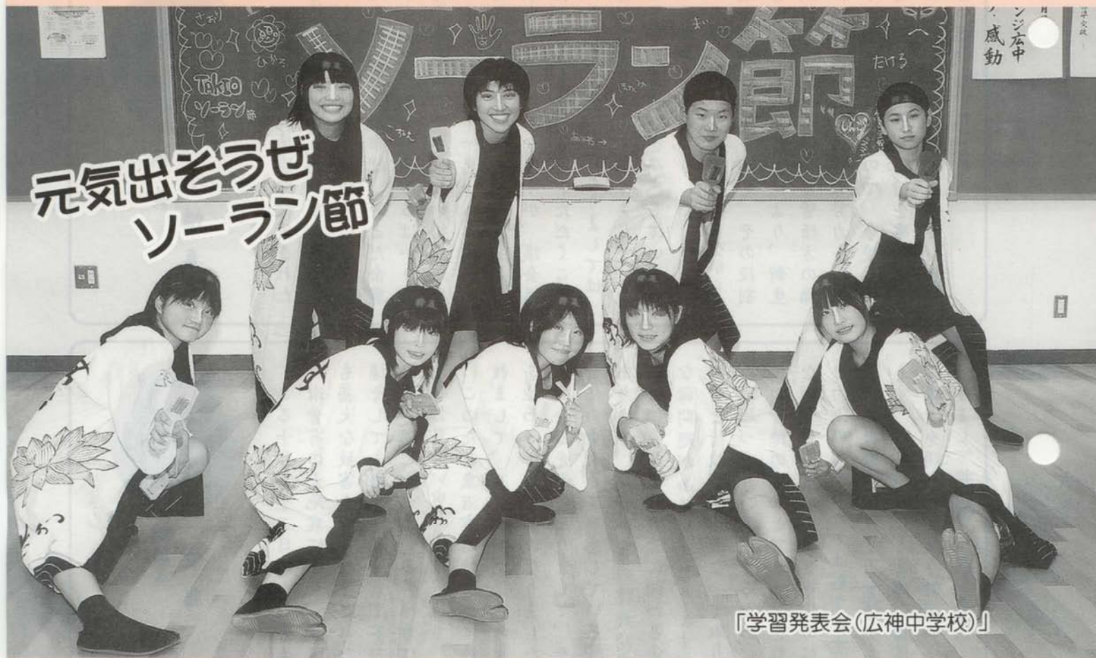
「学習発表会(広神中学校)」