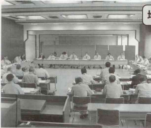
第1回地震災害調査特別委員会