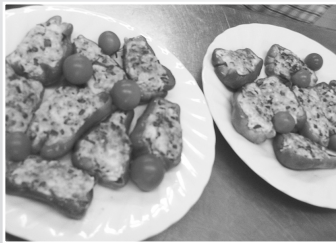
豆腐のアレンジ料理教室