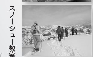
スノーシュー教室