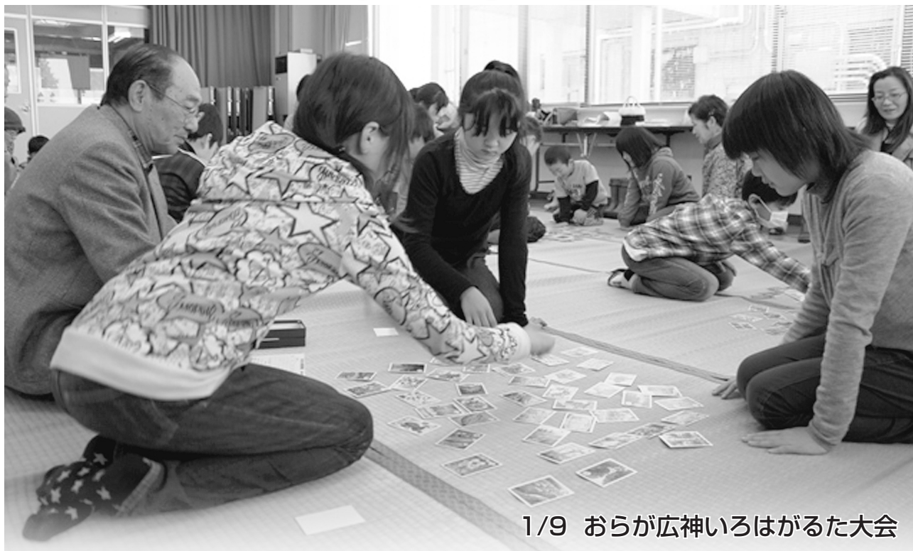
1/9 おらが広神いろはがるた大会