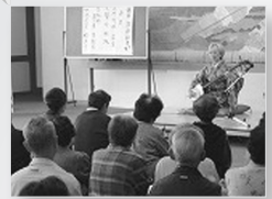
守門高麗者教室 こせ唄公演

地元の方を講師としてお迎えできた健康体操・料理教室は今後も継続し、より充実した内容で定着させていけたらと思います。また、二十三年度は、新たな教室も開催する予定です。大勢の皆さんの参加をお待ちしております。