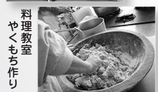
料理教室 やくもち作り