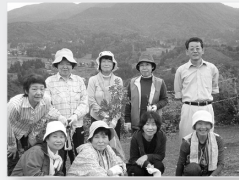
木の実の収集 手芸教室

手芸教室 では、エコなアクリルたわし・布の笹だんごやちまき・山の木の実や種でブローチ作りを、 絵手紙教室 では、暑中お見舞い・年賀状・干支の色紙作りを体験しました。 体操教室 では、骨盤まわり・肩甲骨まわりをやわらかくし、毎日継続できる簡単な健康体操を教えていただきました。和気あいあいと、笑い声の絶えない楽しい教室になりました。