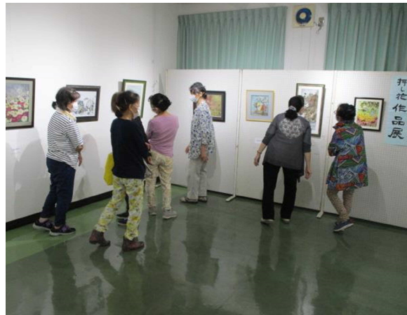
押し花を使用して描いた絵画の数々

「ふしぎな花倶楽部うおぬま」の 今月のギャラリーコーナーは、 会員8名による作品16点を展示 しています。