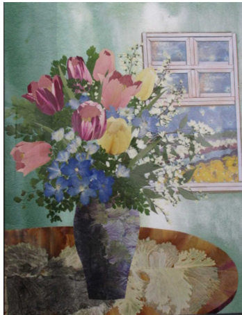
星サチ子さん作品