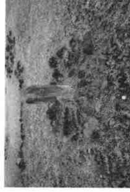
犬湯環状列石の日時計状石組（秋田県）