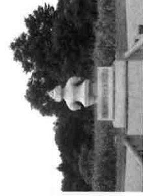
亀ヶ岡石器時代遺跡（青森県）