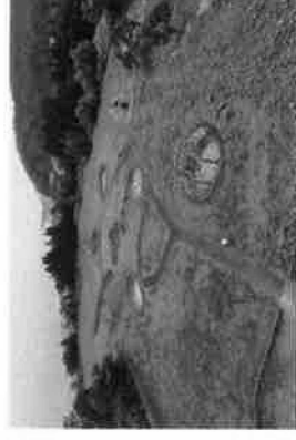
大船遺跡全景（北海道）

長岡市出身。國學院大学名誉教授。縄文文化研究の第一人者。信濃川火焰街道建務協議会顧問、新潟県立歴史博物館名誉館長等を務める。