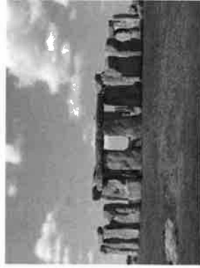
ストーンハンジ外観

セインズベリー日本藝術研究所所長。専門は先史考古学・日本考古学。大英博物館での火焔型土器常設展示、ストーンハンジ・ビジターセンター特別展「ストーンハンジと先史日本」プロジェクト企画立案など、日英文化交流を推進。日本語が堪能、当日英国人講演通訳も務める。