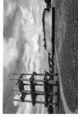
三内丸山遺跡（青森県）