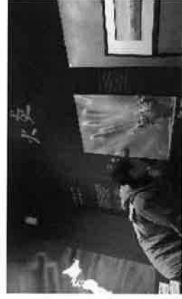
ビジターセンターでの火焔型土器展示状況