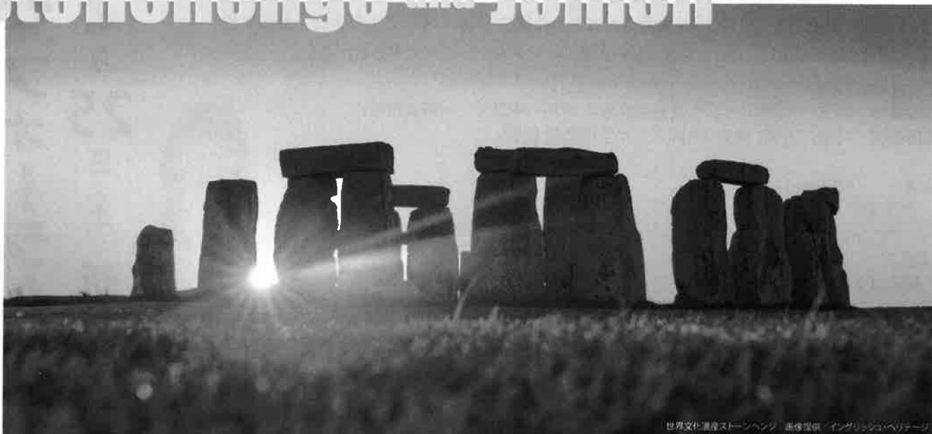
世界文化遺産ストーンヘンジ 日本遺産「なんだ、コレは！」信濃川流域の火焰型土器と曹国の文化